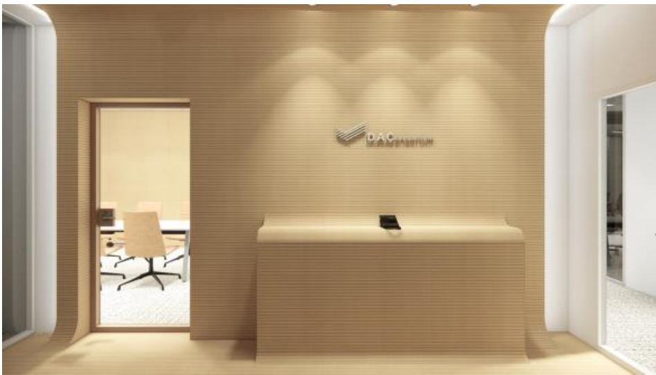
酒樽をイメージしたエントランス(※3)