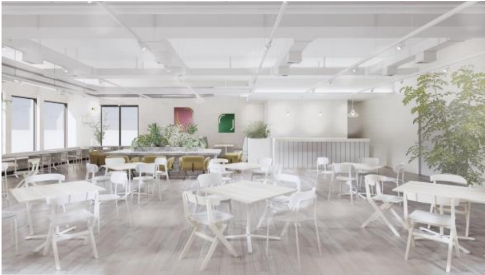
コミュニケーションラウンジ