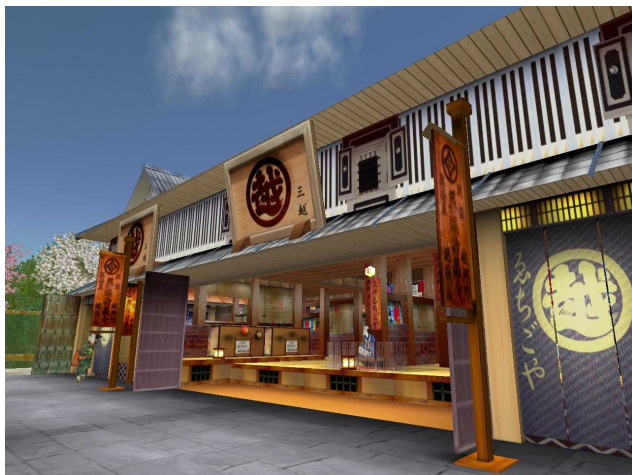
(歴史ゾーン：外観イメージ)