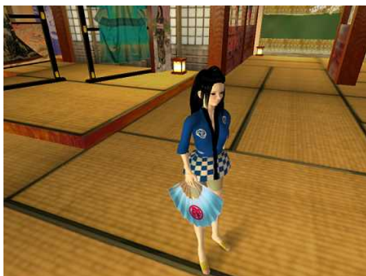
(オブジェクト例：はっぴ&扇子)