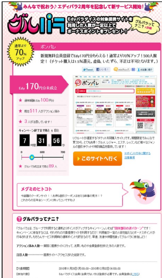
【「グルパラ」イメージ画面】(左:PC、右:モバイル)