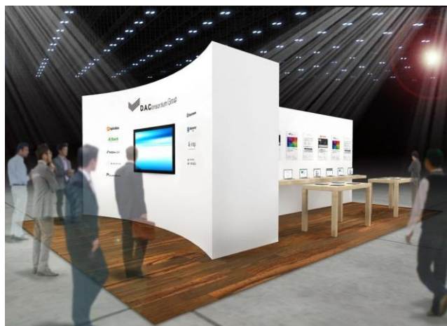
FRUITS BEAR ブース

展示ゾーンでは、DACグループを横断するソリューションプロデュースユニット「FRUITS BEAR」のキャラクターをモチーフにしたブース展開を予定しております。「FRUITS BEAR」参画企業をはじめ、DACグループ各社のソリューションを展示し、ご来場の皆様にご案内を行うほか、各種セミナーも実施予定です。