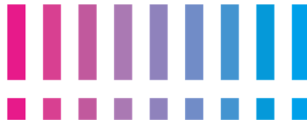
ショッパー マーケティング・イニシアティブ